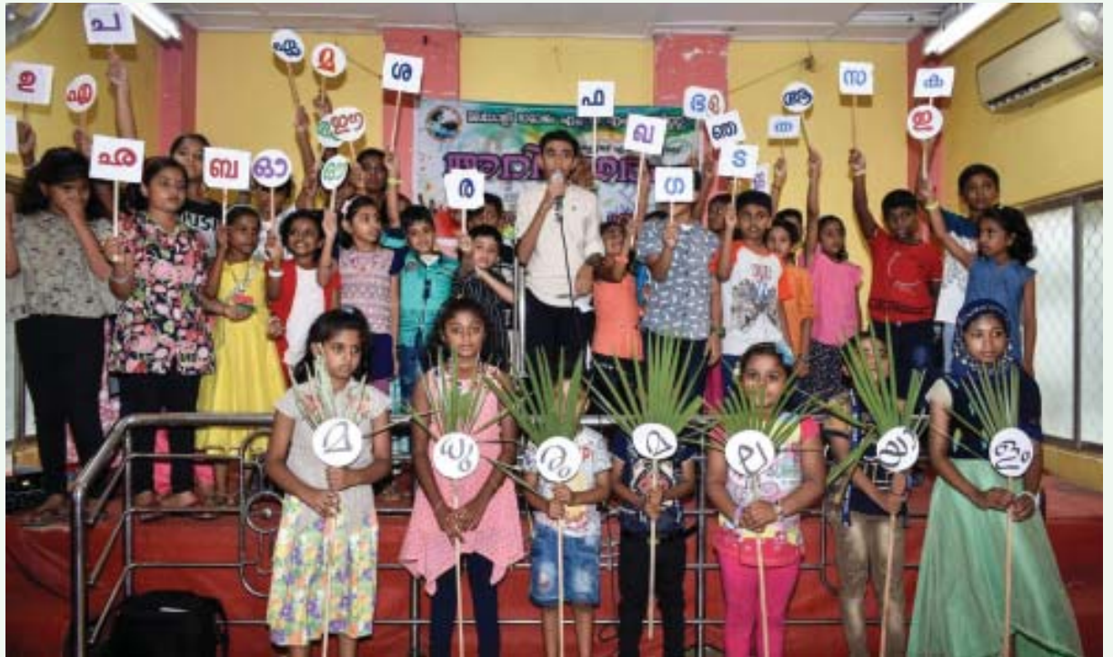
ആവടി മേഖല എച്ച്.വി.എഫ് മലയാളി സമാജം സംഘടിപ്പിച്ച അറിവോരം ഏകദിന ക്യാമ്പിൽനിന്ന്