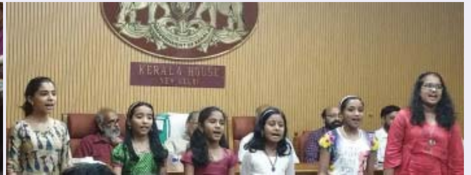
ഡൽഹി മലയാളം മിഷന്റെ പത്താം വാർഷികാഘോഷങ്ങളിൽനിന്ന്