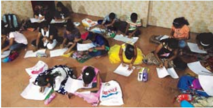
ഐരോളി കേന്ദ്രത്തിലെ പ്രവേശനോത്സവത്തിൽനിന്ന്

മുംബൈ: കൈരളി കൾച്ചറൽ ആന്റ് എഡ്യൂക്കേഷണൽ അസോസിയേഷൻ ഐരോളിയുടെ കീഴിലുള്ള മലയാളം മിഷന്റെ 6 പഠനകേന്ദ്രങ്ങളും സംയുക്തമായി പ്രവേശനോത്സവം സംഘടിപ്പിച്ചു. ജൂൺ 23-ന് സെക്ടർ 10-ലെ സെന്റ് ജോസഫ് പള്ളിയിൽ സംഘടിപ്പിച്ച ചടങ്ങിൽ നിരവധി പേർ പങ്കെടുത്തു. പ്രവേശനോത്സവത്തിൽ കുട്ടികൾക്കായി ചിത്രരചനാ മത്സരം നടത്തി സമ്മാനങ്ങൾ നൽകി. ചടങ്ങിൽ മിഷനിലെ അധ്യാപകരെ ആദ