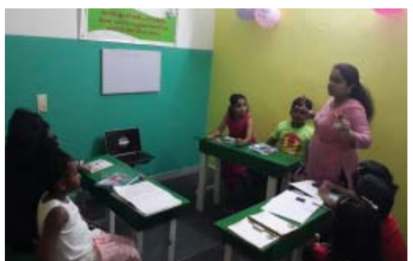
ബെനിൻ മേഖലയിലെ ആദ്യ പഠനകേന്ദ്രത്തിൽനിന്ന്

ബെനിൻ: രാജ്യാതിരുകൾ കടന്ന് മലയാളി ഉള്ളിടത്തെല്ലാം മലയാളം വ്യാപിക്കുകയാണ്. മലയാളം മിഷനിലൂടെ മലയാളഭാഷ ഇപ്പോൾ വെസ്റ്റ് ആഫ്രിക്കയിലും എത്തിയിരുന്നു. ജൂലൈ 27 ന് മിഷന്റെ ആദ്യ പഠനകേന്ദ്രം ബെനിനിൽ ആരംഭിച്ചു. വേൾഡ് മലയാളി ഫെഡറേഷന്റെ (WMF) സഹകരണത്തോടെയാണ് പഠനകേന്ദ്രം ആരംഭിച്ചത്.