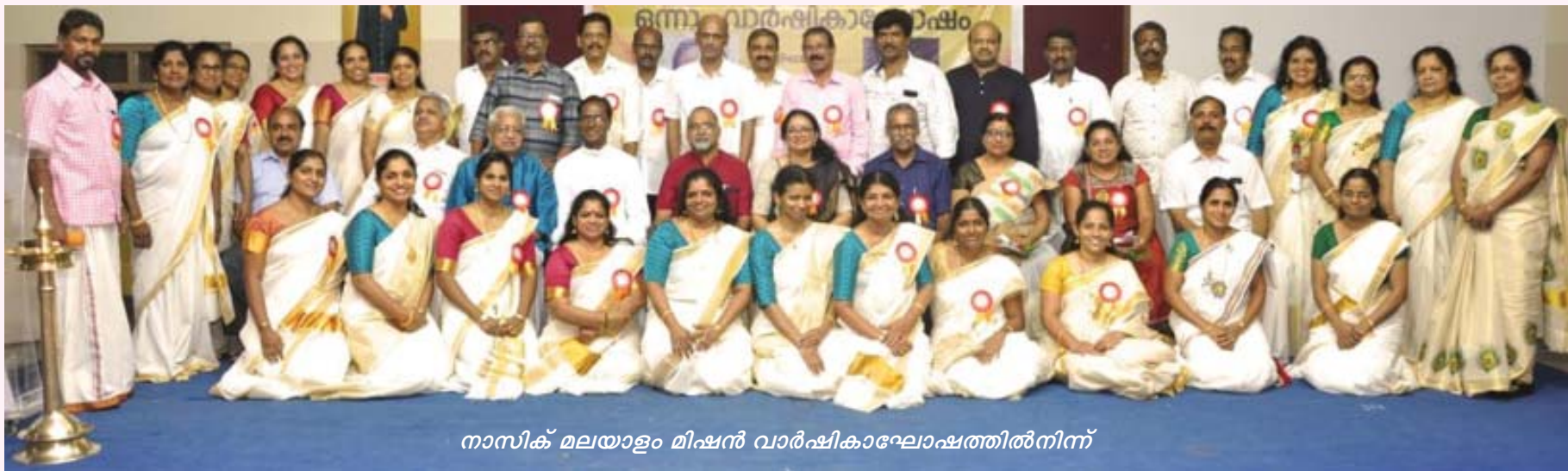
നാസിക മലയാളം മിഷൻ വാർഷികാഘോഷത്തിൽനിന്ന്