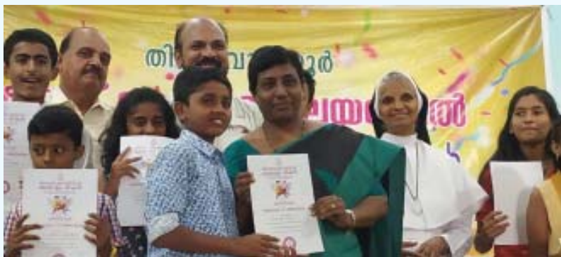
സെന്റ് ജൂഡ് ദേവാലയത്തിൽ നടന്ന പ്രവേശനോത്സവം

കേരളത്തിലെ പ്രളയക്കെടുതി നേരിടുന്നവരെ സഹായിക്കാനായി മിഷൻ തയ്യാറാക്കിയ 'ചങ്ങാതിക്കുടുക്ക്' പദ്ധതിയുടെ ഭാഗമായ വിദ്യാർത്ഥികൾക്ക് സർട്ടിഫിക്കറ്റുകൾ നൽകി. വെള്ളം അമൂല്യമാണ് എന്ന സന്ദേശം ഉൾക്കൊള്ളുന്ന നൂത്തരുപവും ചടങ്ങിൽ അരങ്ങേറി.