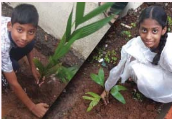
കുട്ടികൾ തൈ നടുന്ന മിഷൻ വിദ്യാർത്ഥികൾ

മുംബൈ: കവറിനുള്ളിലാക്കി വരുന്ന വൃക്ഷ തൈകൾ വേണ്ടെന്ന് അവർ തീരുമാനിച്ചു. ഇരു