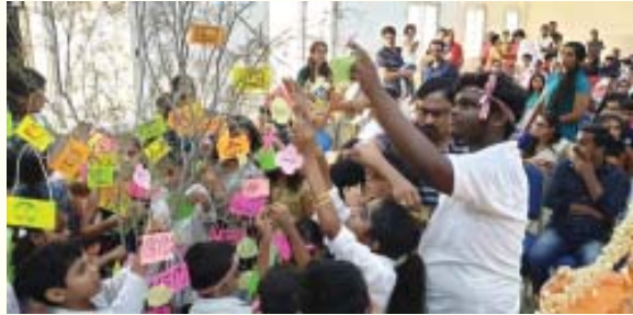
ദുബൈ സർഗ്ഗസംഗമത്തിൽ അക്ഷരമരമൊരുക്കുന്ന കുട്ടികൾ

കുറുന്നുകളിൽ കൗതുകമുണർത്തി കേരളീയ ജീവിത പഴമ നിറഞ്ഞ പ്രദർശനം. ദുബായ് മലയാളം മിഷനാണ് ഈ അപൂർവ്വ പ്രദർശനം ഒരുക്കിയത്. മിഷൻ സംഘടിപ്പിച്ച സർഗ്ഗസംഗമത്തിലാണ് പ്രദർശനം നടന്നത്. ഒരു കാലത്ത് കേരളീയ ഗ്രാമജീവിതത്തിന്റെ ഭാഗമായിരുന്ന മൺകുജ, ചിരട്ടത്തവി വിവിധതരം മൺപാത്രങ്ങൾ തുടങ്ങിവ പരിചയപ്പെടുത്തിയ പ്രദർശനം കുറുന്നുകൾക്ക് പുതുമയായി.